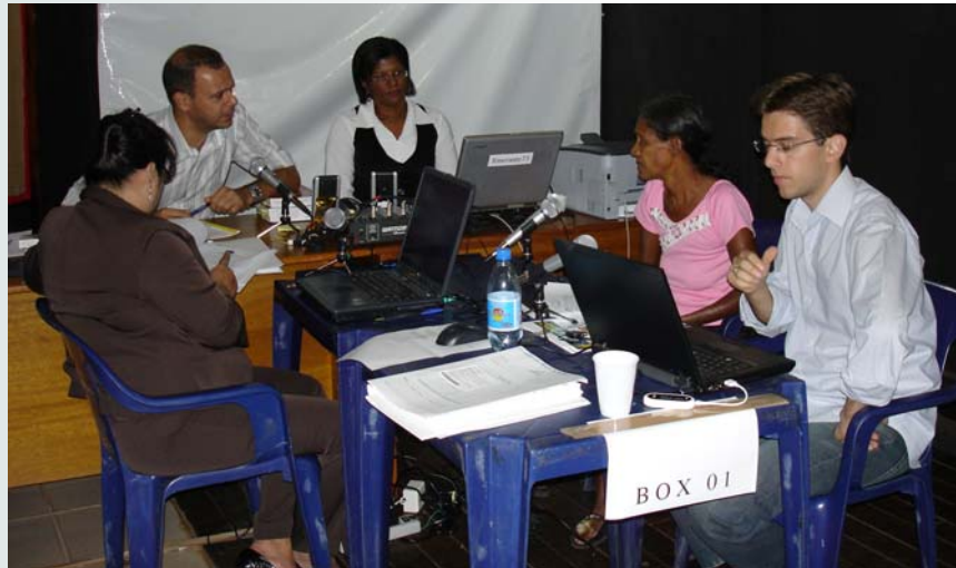
equipe da Justiça Federal atuando no juizado itinerante de Rolim de Moura

A Justiça Federal realizou, no período de 22 a 27 de junho, a segunda fase do Juizado Especial Itinerante na cidade de Rolim de Moura. O saldo desse trabalho não poderia ser melhor: foram homologados 240 acordos e proferidas 206 sentenças. Os munícipes daquela localidade foram atendidos no Teatro Municipal, no centro da cidade, onde atuou uma equipe de servidores encarregada de auxiliar os juízes federais que estavam realizando as audiências e, em muitos casos, sentenciando ao vivo os processos que estavam sendo apreciados naquela jornada de prestação do serviço jurídico.